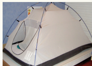
Enfin pouvoir dormir !

Nous diffusons notre information auprès de nombreux parents, professionnels et associations concernés :