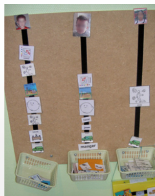
Visualiser le déroulement de la journée